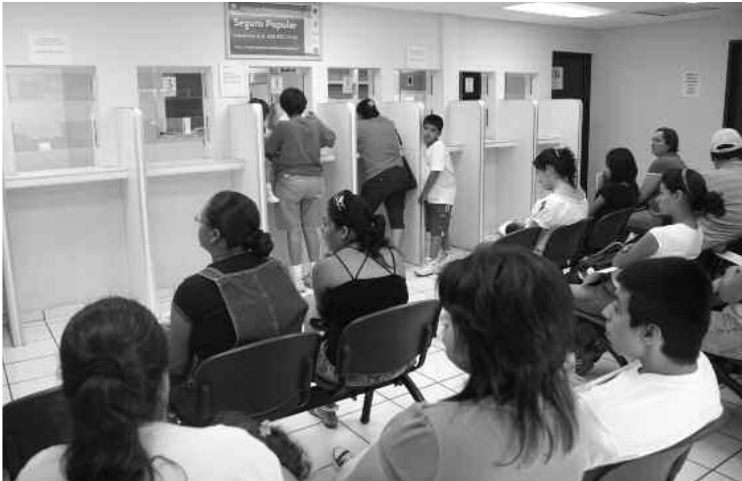
De diciembre de 2009 a la fecha el Seguro Popular en Sonora ha registrado un incremento del 25 por ciento en afiliaciones, es decir 128 mil 235 personas más tienen servicio médico, logro que mantiene al estado muy cerca de la meta establecida, pese a que este servicio estuvo cerrado durante dos años.

Actualmente, en Sonora existen 25 módulos de afiliación y orientación, y 14 módulos de gestión médica, ubicados en hospitales, Centros